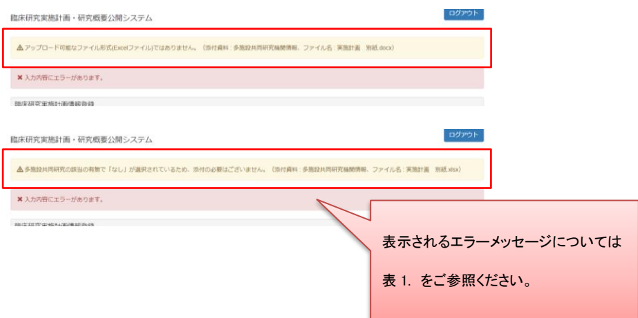
表 1. エラーメッセージ一覧

「多施設共同研究の該当の有無」項目で「なし」を選択された場合や、Excel 形式(xls, xlsx)以外の形式でファイルを作成、添付された場合は、資料の添付はできませんのでご注意ください。